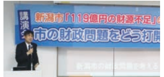
市議団が主催した新潟市の財政問題の講演会(2月14日)

2月13日に新潟市が発表した2018年度当初予算案は、17年度比173億円減(△4.4%)の3802億円となりました。「119億円の財源不足」と言われているなか、全事務事業点検により46億円、公債費積立ルールの変更で26億円など計90数億円の調整を行うことにより予算案が編成されました。