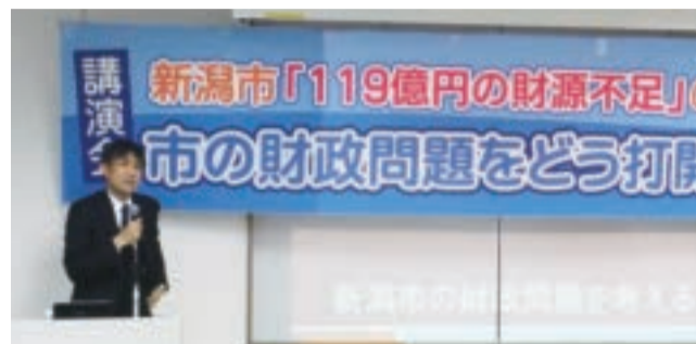
市議団が主催した新潟市の財政問題の講演会(2月14日)

2月13日に新潟市が発表した2018年度当初予算案は、17年度比173億円減(△4.4%)の3802億円となりました。「119億円の財源不足」と言われているなか、全事務事業点検により46億円、公債費積立ルールの変更で26億円など計90数億円の調整を行うことにより予算案が編成されました。