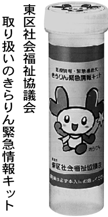
東区社会福祉協議会 取り扱いのきらりん緊急情報キット

問 一人暮らし高齢者世帯に配布される緊急情報キットの普及は、対象世帯へ主治医からの啓発が必要であり医師会の協力を求めました。 答 医師にとっても有用でありキットの普及と運用について医師会と意見交換をしていく。